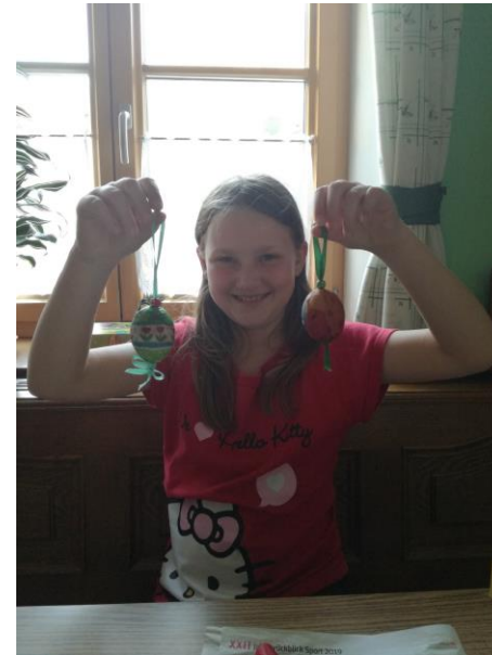
Eier verzieren (mit Serviettentechnik)