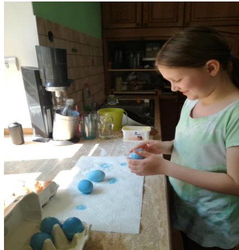
Beim Ostereier - färben